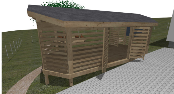
Obec Vražné, č. p. 37, 74235 Vražné