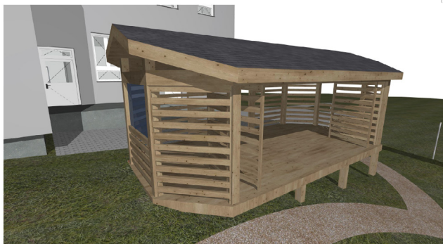
Obec Vražné, č. p. 37, 74235 Vražné