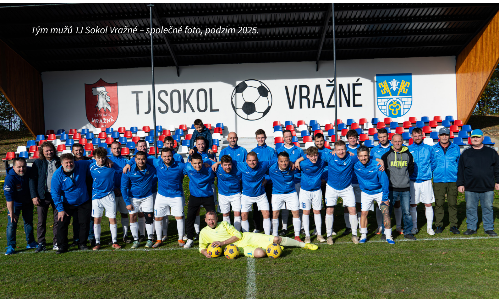
Tým mužů TJ Sokol Vražné – společné foto, podzim 2025.